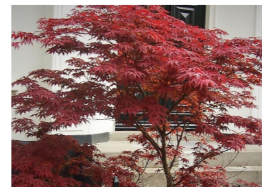
T2 - Japansk blodlönn Acer palmatum 'Atropurpureum'

Blomsterfunkia Hosta fortunei 'Francee' Gullgröna Waldsteinia terinata Stjärnflocka Astrantia Florence Murgröna Hedera Helix i framkant av planteringskär.