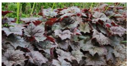
Rödblåg Alunrot, Heuchera micrantha