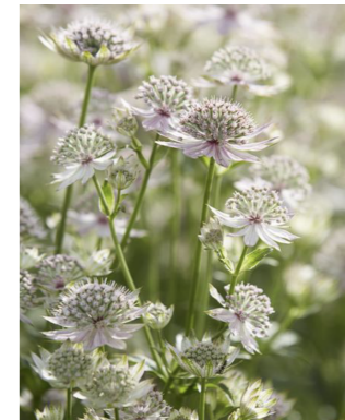
Stjärnflocka Astrantia Florence