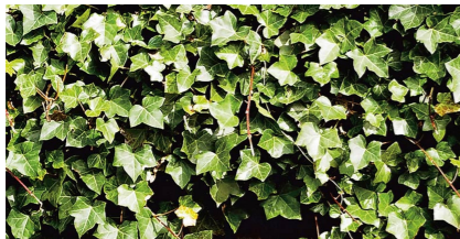
Storbladig murgrön Hedera hibernica mot mur/spaljénät.