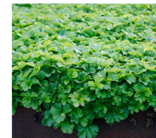
Gullgröna Waldsteinia terinata