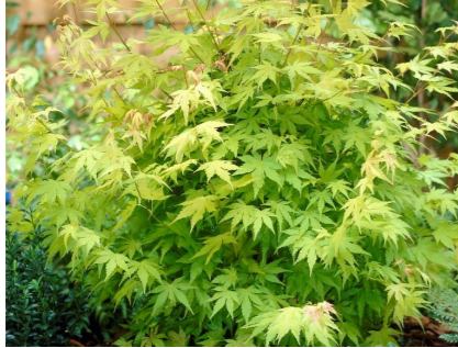
T1 - Japansk lönn Acer palmatum 'Orange Dream'

1 st planteringskär i corten, 1500x900x600 mm 1 st planteringskär i corten, 2000x700x600 mm Placerade mot mur med spaljé/nät 2200x2800 mm