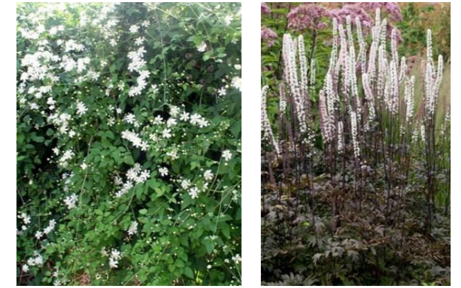
Vitalba-Klematis 'Paul Farges' mot mur/spaljénät. Höstsilverax Actaea simplex 'Brunette'

Blomsterfunkia Hosta fortunei 'Francee' Strutbräken Matteuccia struthiopteris Rödblåg Alunrot, Heuchera micrantha Murgröna Hedera Helix i framkant av planteringskär.