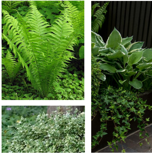
Klätterbened 'Emerald Gaiety' Blomsterfunkia Hosta fortunei 'Francee' Strutbräken Matteuccia struthiopteris Murgröna Hedera Helix i framkant av planteringskär.