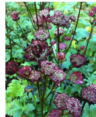
Stjärnflocka Astrantia 'Hadspen Blood'

Murgröna Hedera Helix i framkant av planteringskär.